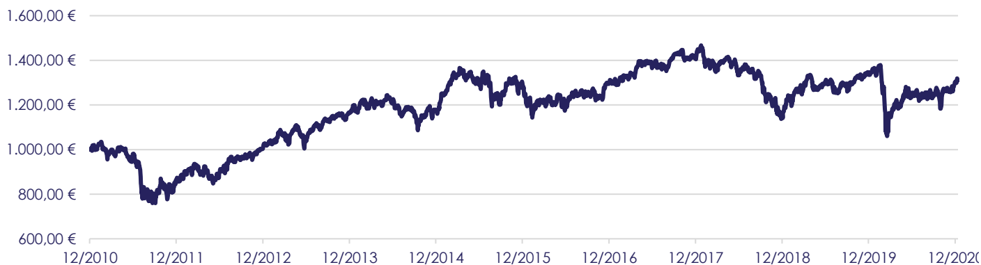
Gráfico de Evolução do Valor das Unidades de Participação em Euros, desde a Criação do Fundo