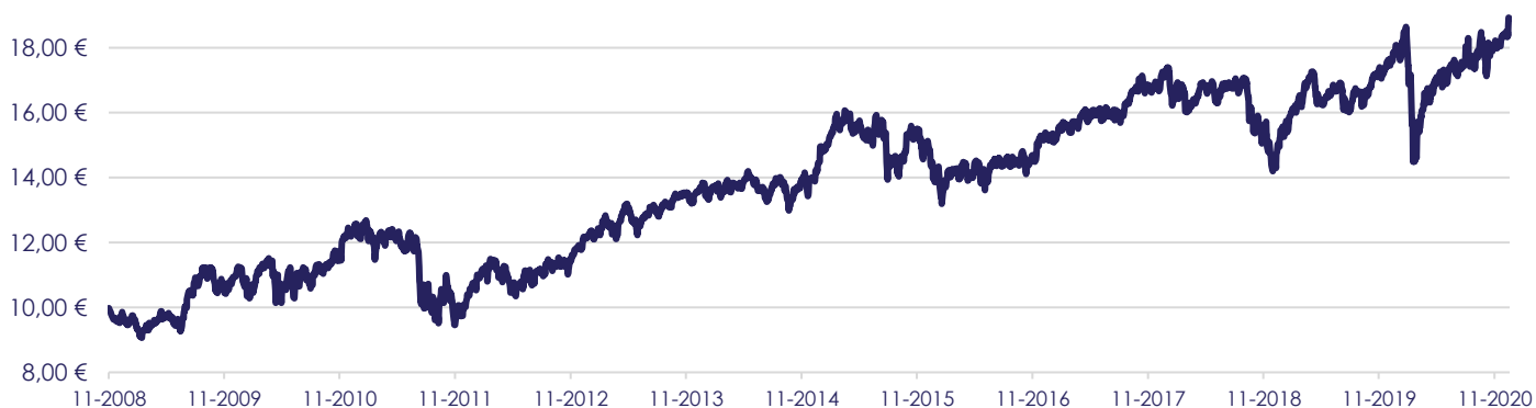
Gráfico de Evolução do Valor das Unidades de Participação em Euros, desde a Criação do Fundo